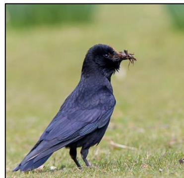
Abbildung 2: links Saatkrähe, rechts Rabenkrähe