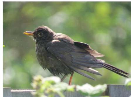
Die Amsel – ein häufiger Brutvogel in Rheinland-Pfalz

Info: https://www.dda-web.de/aktuelles/meldungen/aus-den-auge-aus-dem-sinn-neue-studie-untersucht-korrelation-zwischen-artenkenntnis-und-bestandsabnahmen