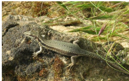
Mauereidechse ( Podarcis muralis )

Info: http://doi.org/10.1098/rsbl.2025.0326